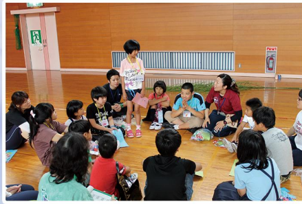
信太小学校との交流