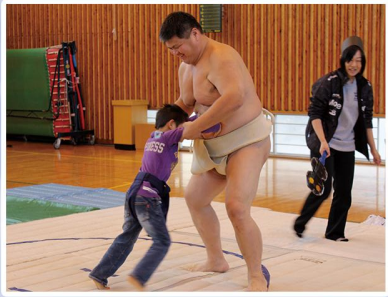
おすもうさんとたのしもう