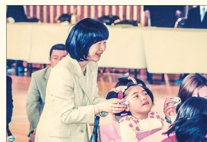
紀宮清子内親王殿下ご視察