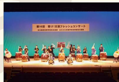
フレッシュコンサート