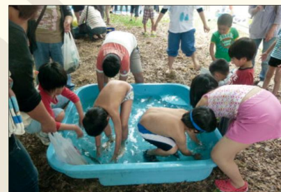
親子あゆ・あまごつかみ体験教室